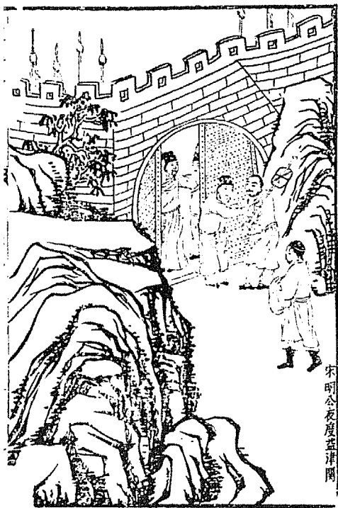
宋明公夜度益津關